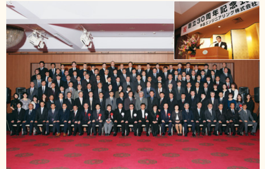
2017年に迎えた創立30周年では、全社員が集結して記念式典を開催。毎年5月には全社員会議、年末には忘年会を開き、社員の労をねぎらっています。

業務における弊社の強みは、正社員比率の高さと社員の人柄の良さ。案件の95%を正社員が心を込めて行い、その仕事の正確さやお客様への細か